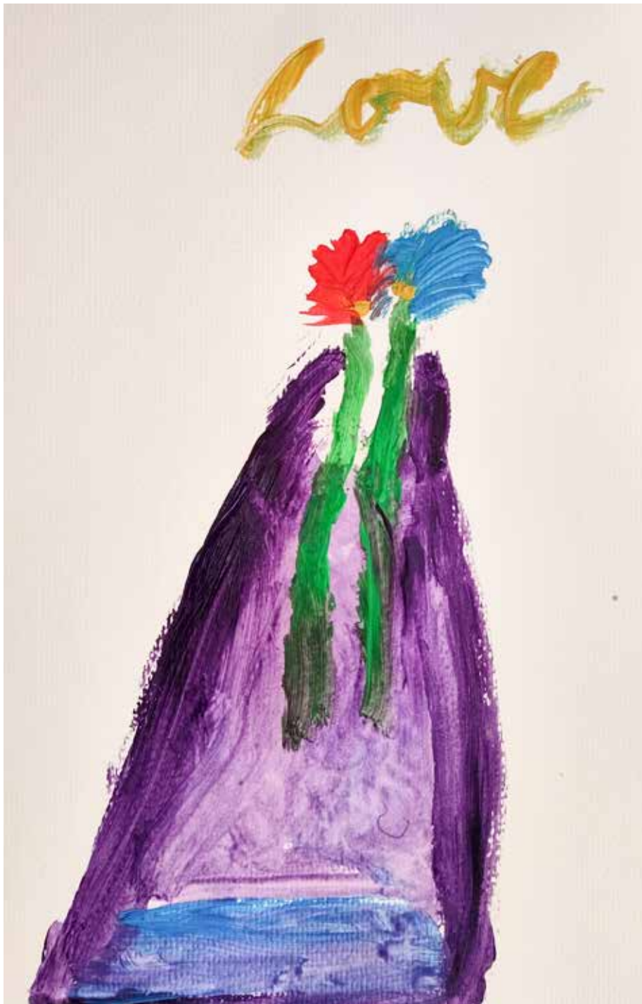
Aus dem dt-cz Malworkshop 2023